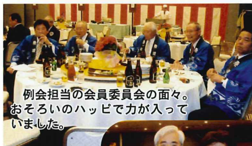
例会担当の会員委員会の面々。 おそろいのハッピーで力が入っ ていました。