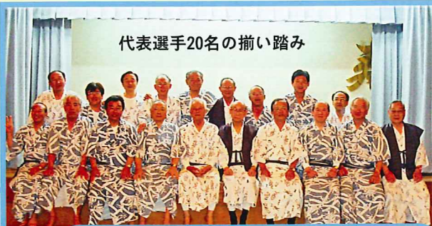
代表選手20名の揃い踏み