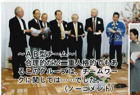
～AB型チーム～ 合理的だが三重人格的でもあ るこのグループは、チームワー クに関しては……でした。 (ノーコメント)