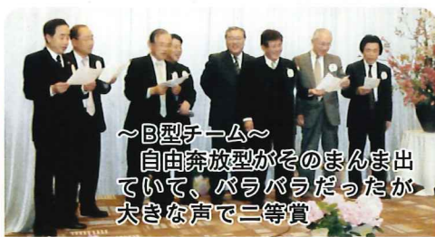
～B型チーム～ 自由奔放型がそのまま出 ていて、バラバラだったが 大きな声で二等賞