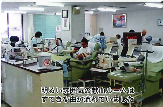
明るい雰囲気 of 献血ルームは すてきな曲が流れていました