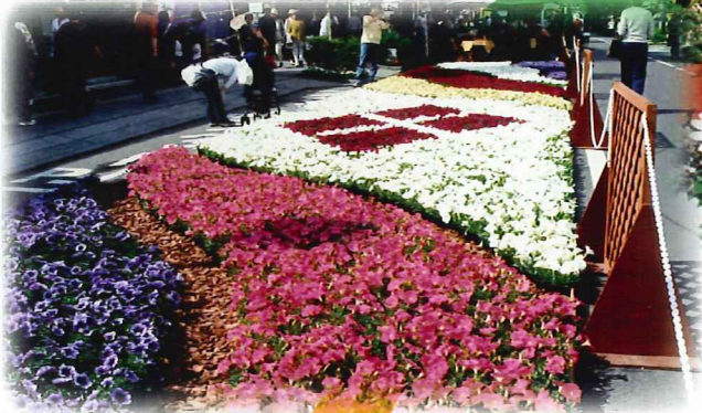
須坂園芸高校の生徒さんの作品