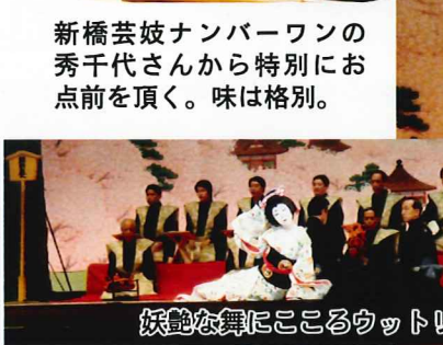
妖艶な舞にこころウットリ