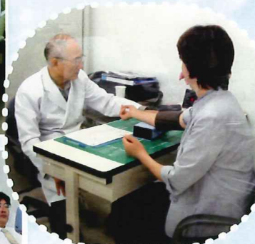
ししも参加、献血前の 健康チェック