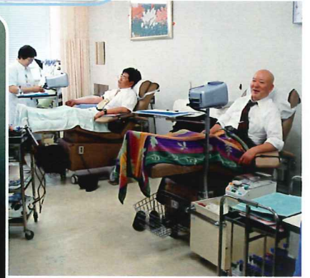
この二人で2リットルくらいは採れそうです 岩間し、関谷し