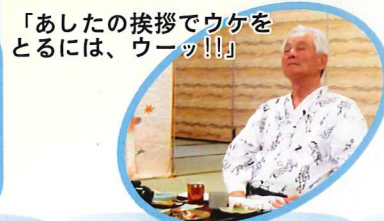
「あしたの挨拶でウケをとるには、ウーッ!!!」