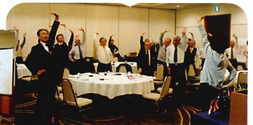
「背すじを伸ばして下さいー」