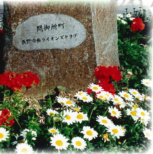
当クラブ寄贈の道標も花で埋まりました