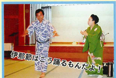
伊那節はこう踊るもんだよ!