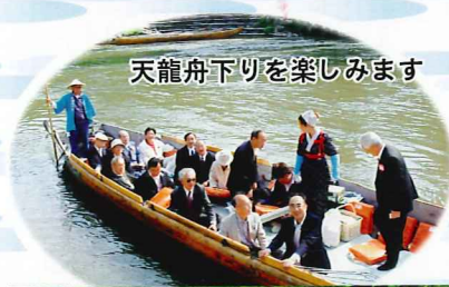
天龍舟下りを楽しみます