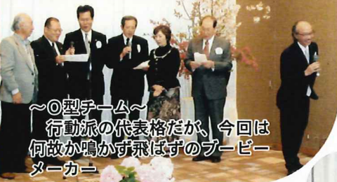
～O型チーム～ 行動派の代表格だが、今回は 何故か鳴かず飛ばすのブービー メーカー