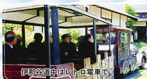
伊那谷道中はレトロ電車で