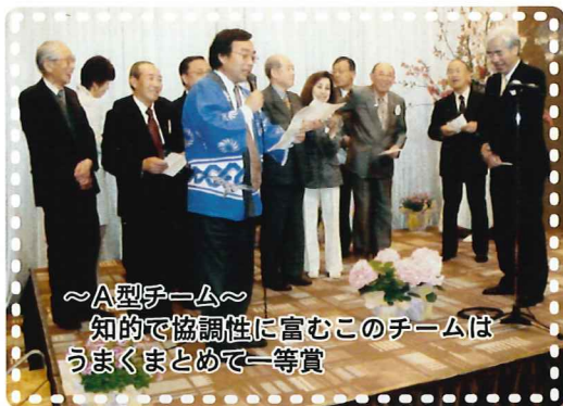
～A型チーム～ 知的で協調性に富むこのチームは うまくまとめて一等賞