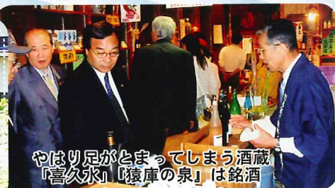
やはり足がとまってしまう酒蔵 「喜久水」「猿庫の泉」は銘酒