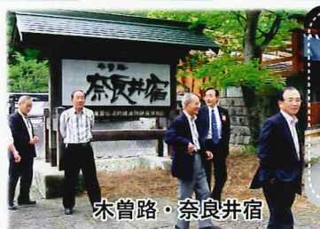
木曾路・奈良井宿