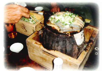
お江戸名物“どぜう鍋”