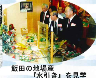
飯田の地場産 「水引き」を見学