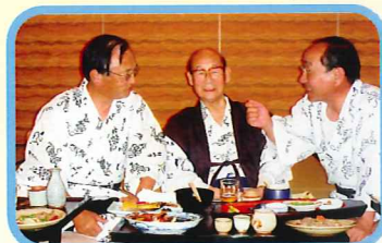
長老を押しつけて激論