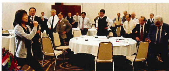
「おなかを締めてー」 つい講師の先生にウツリ?