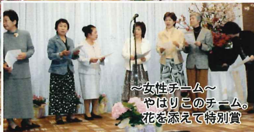
～女性チーム～ やはりこのチーム。 花を添えて特別賞