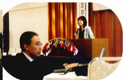
若林しもプロジェクター操作で お手伝い