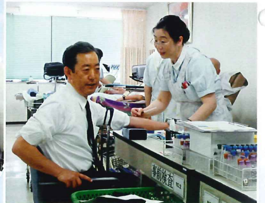
「とても良い血液ですねー…」 久野し