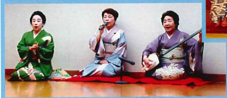
レトロに輝く綺麗なお姐さんたちでした。