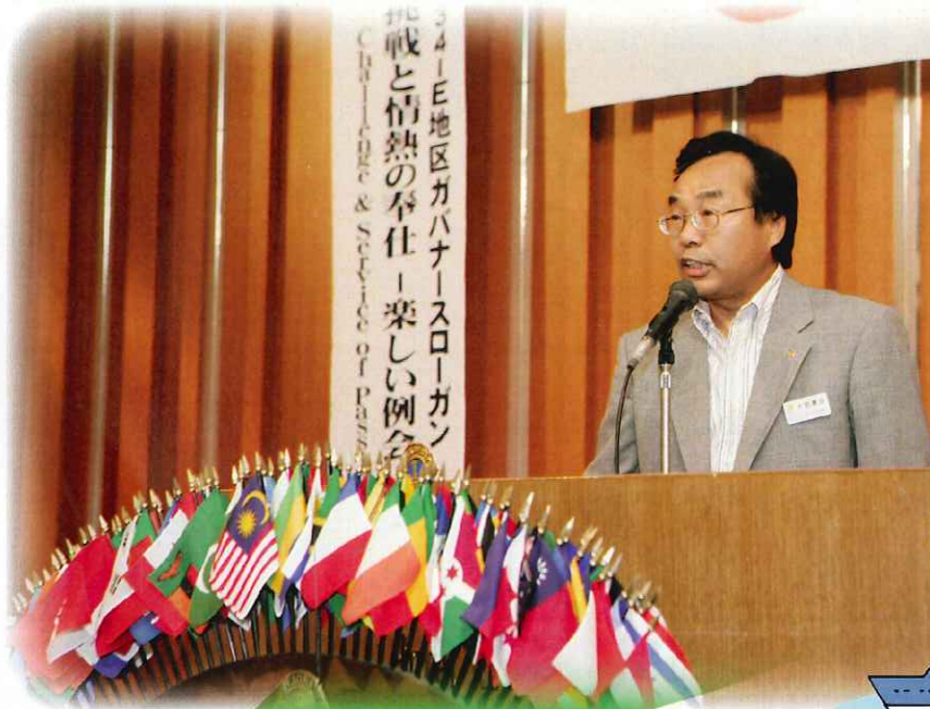
第44期 大前会長 方針演説