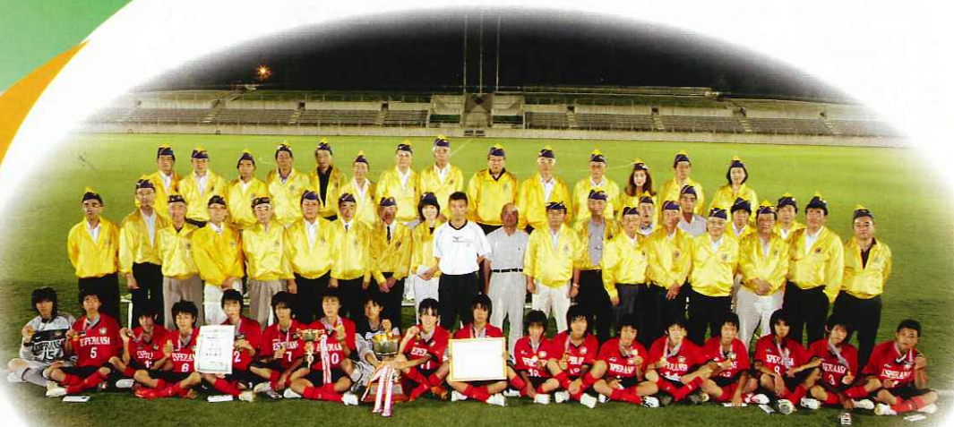
未来のJリーガーを目指す熱き中学生と