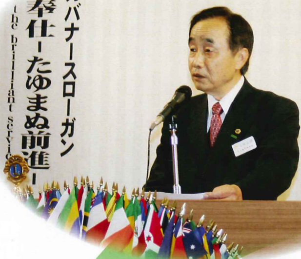
第45期 上田会長 会長方針発表

この区ガバナーズローガン 「知恵と創造力を 発揮して夢のある奉仕」 を The brilliant service