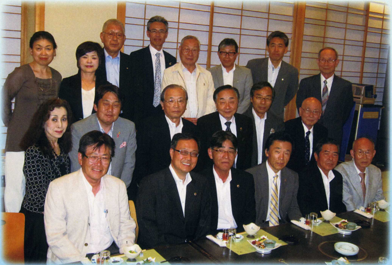
49期、委員長合同 最終理事会