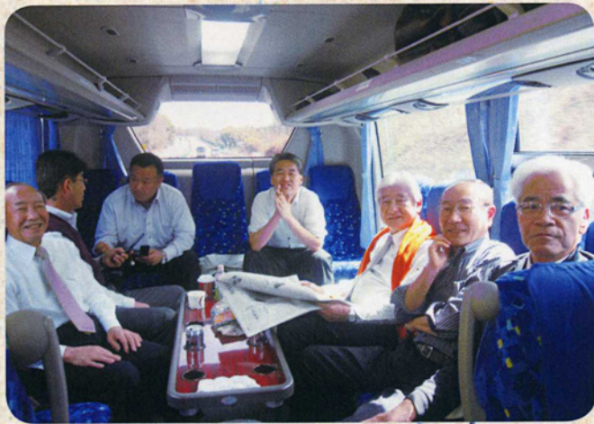
4月3日 名古屋中L.C, CN50周年行きのバスの中