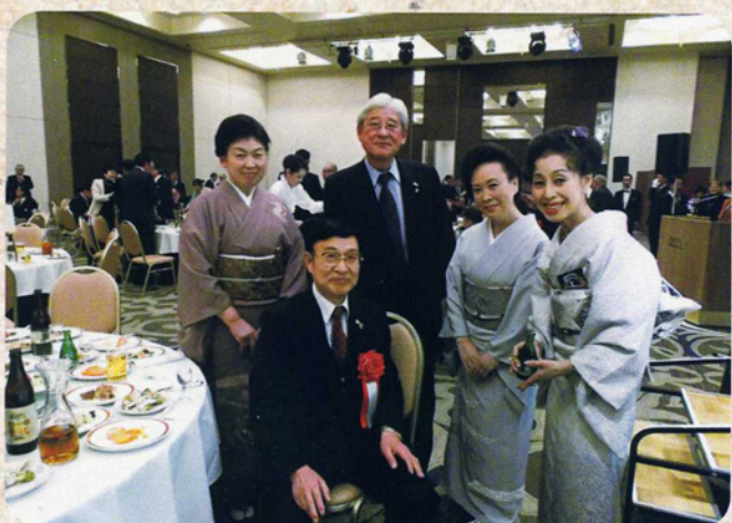
甘利ガバナー公式訪問