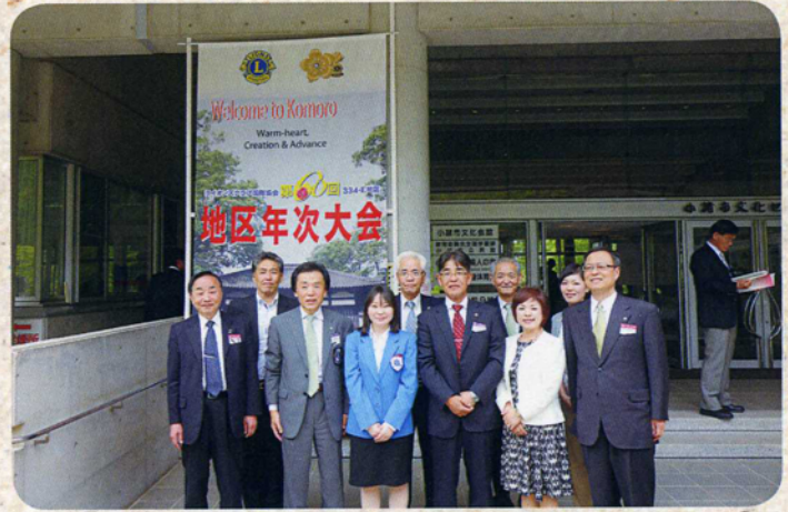
小諸地区年次大会