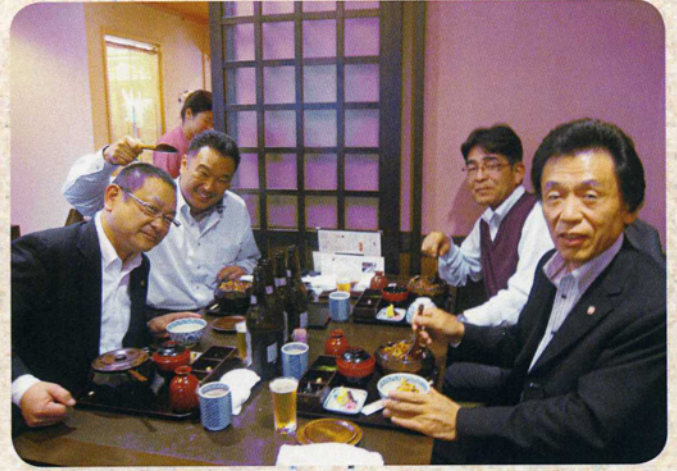
4月3日 あつた蓬莱軒での昼食