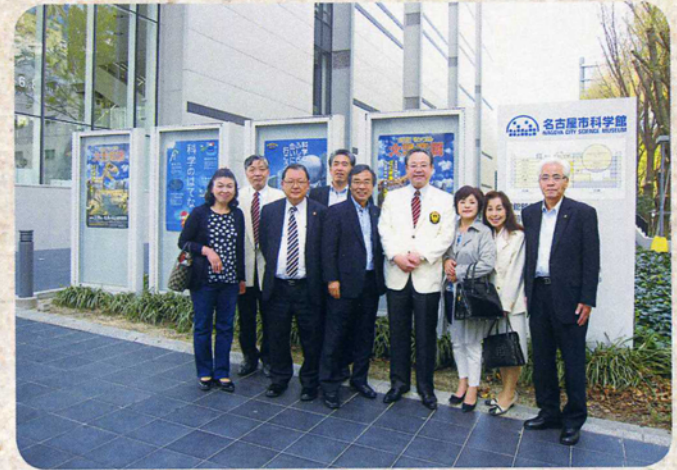
4月4日 名古屋中L.C, CN50 エクスカーション