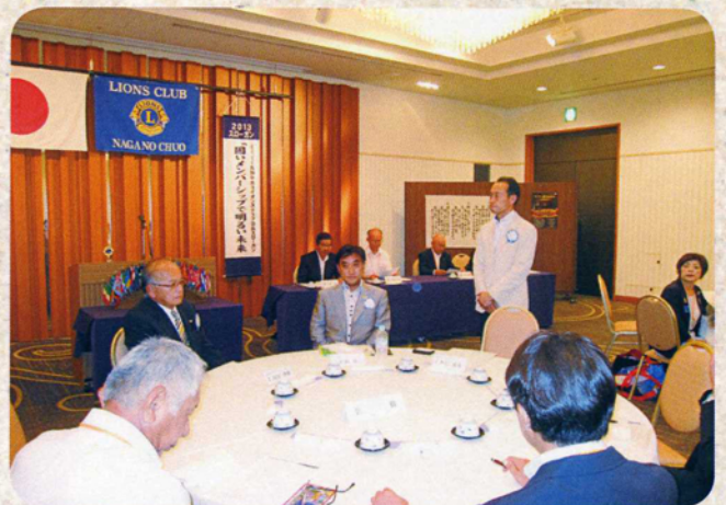
L. 仁科ゾーンチェアパーソン来訪