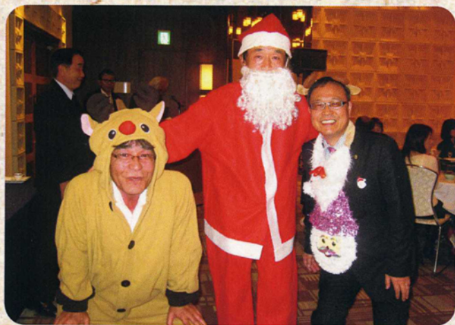
家族合同クリスマス会