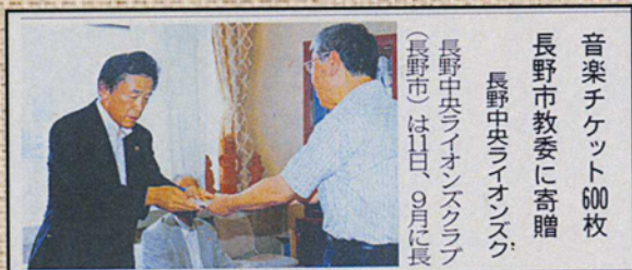
音楽チケット600枚 長野市教委に寄贈 長野中央ライオンズクラブ