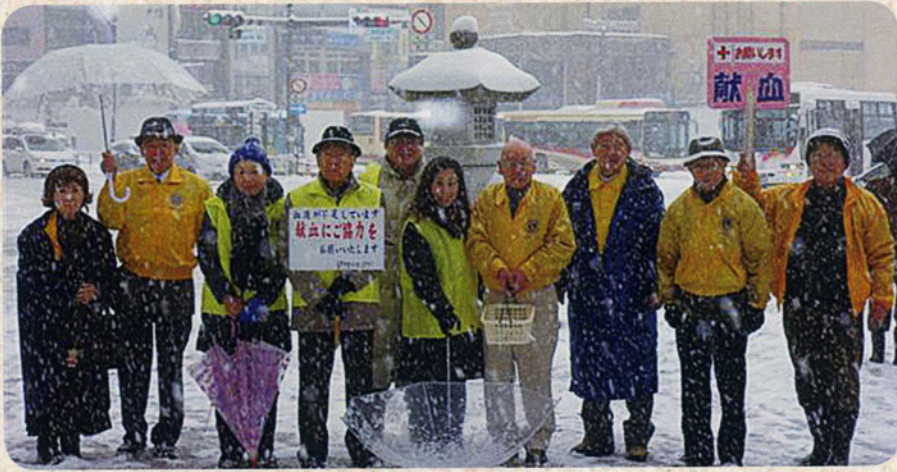
大雪の献血サブディ