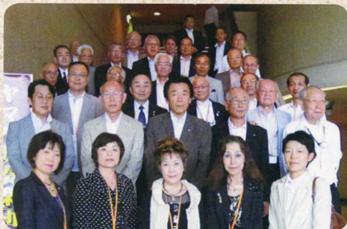
ヤマハ吹奏楽団の参加メンバー