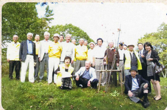
探葉例会戸隠高原