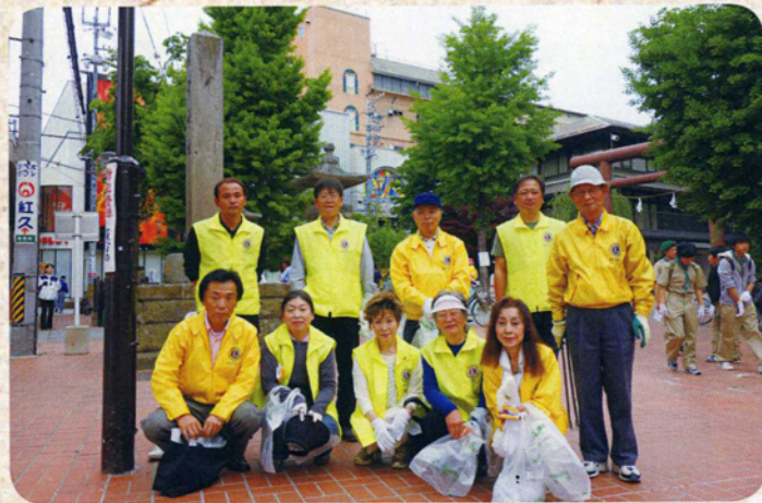
春のごみゼロ運動