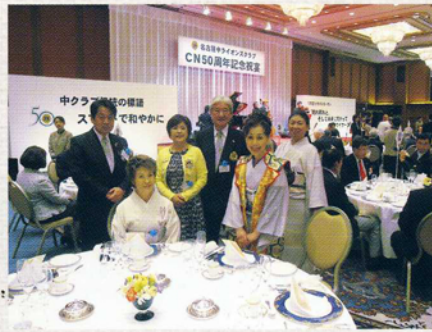
名古屋中 L.C CN50周年記念の様子