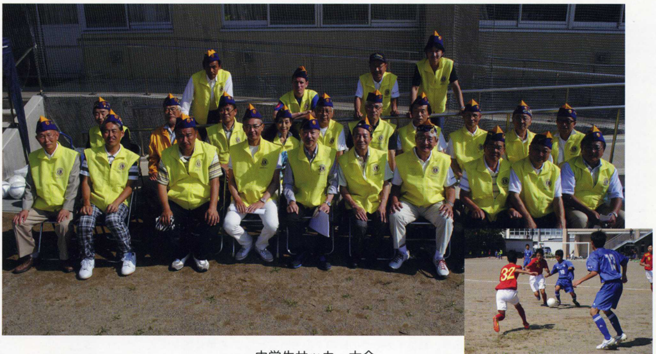
中学生サッカー大会