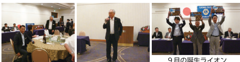
9月の誕生ライオン

去る8月27日には、今期の大きなイベントの主催となった「334E地区2R3Zガバナー公式訪問合同特別例会」を無事に終えたこともあり、多くの会員にほっとした表情も見られました。一息ついたところではありますが、今後も会員増強への意識は常に持ちながら、次は当クラブメインのアクティビティ、10/27の「フードドライブ」に向けて、準備を進めてまいりましょう。