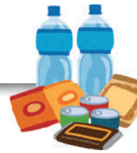
長野経済新聞11月5日発行 4面に掲載