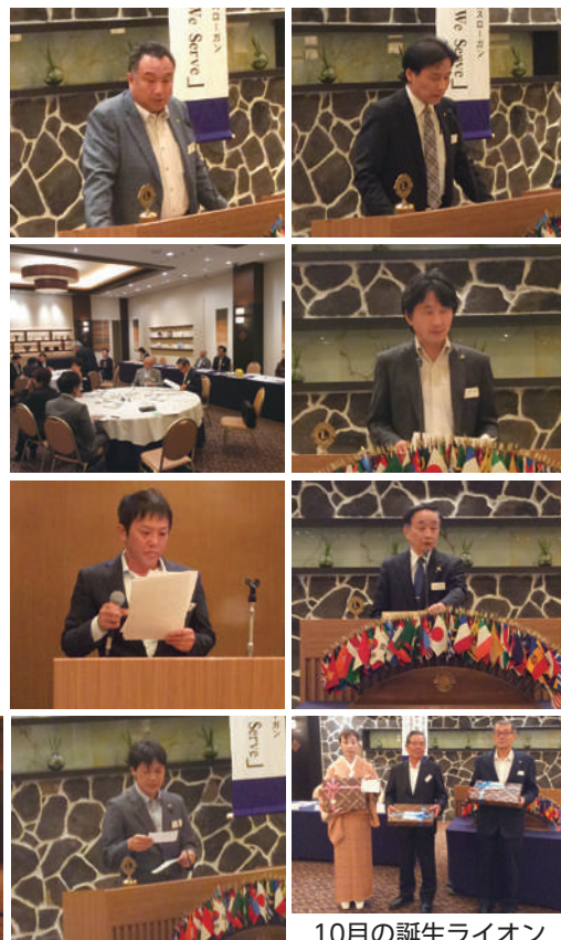
10月の誕生ライオン

10/27のフードドライブが成功できるよう、皆で力を合わせてまいりましょう。皆様のご協力をよろしくお願いいたします。