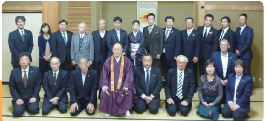
11/14 お十夜例会・大勧進