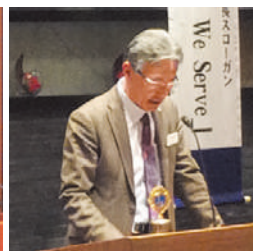
1月の誕生ライオン