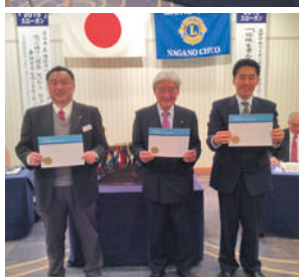
2月の誕生ライオン