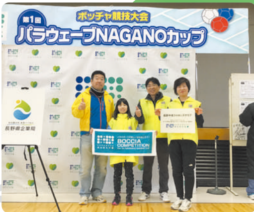
2/11 ボッチャ県大会出場