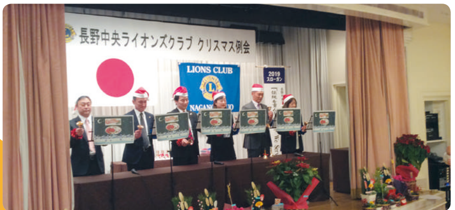
12/26 家族とともにクリスマス例会

☆334複合地区スローガン “We Serve”心を合わせ多様な奉仕 ☆334-E地区 地区スローガン 培った絆で『情熱 思いやり 努力』 奉仕するセカンドセンチュリー ～多様性を受け入れた 「サーバントリーダーシップ」の推進～