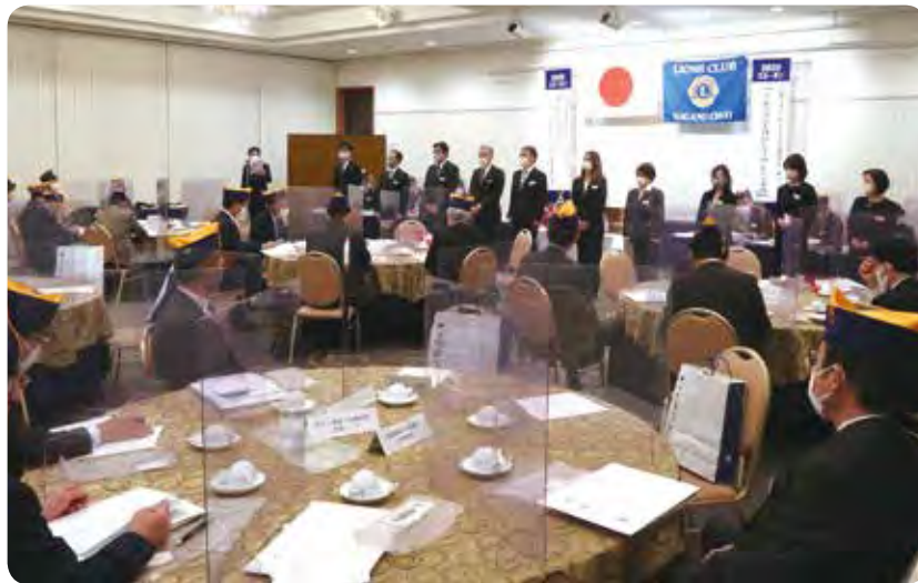
1年振りの当クラブ主催の例会は入会式から