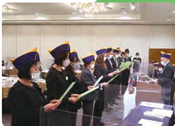
新会員による「ライオンズの誓い」朗読