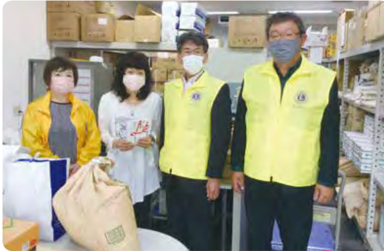
6/23 フードバンク信州様へ寄付金とライオン有志からご提供の食糧をお届け