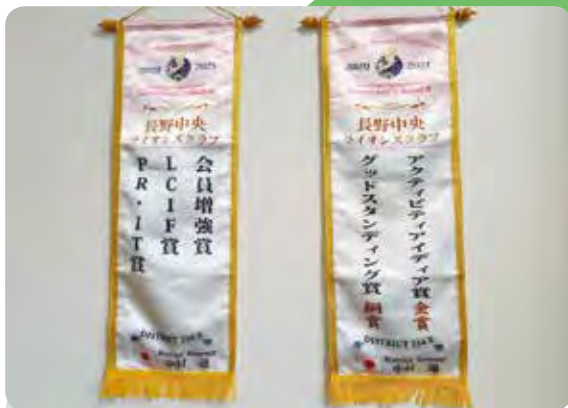
4/25 地区年次大会にて受賞