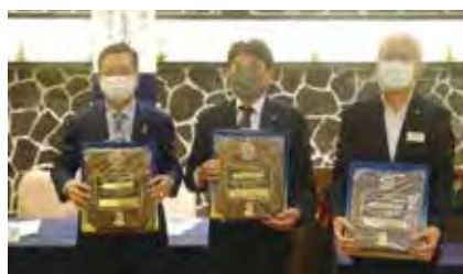
ピンと盾の授与 LCIF メルビン・ジョーンズ・フェロー(MJF)アワード

我々のフードドライブは、食品ロス減量に結び付く社会貢献度が高いこと、更に、社会的意義のある重要な活動です。来年3月に予定しております市民奉仕・環境保全委員会担当の「第15回フードドライブ」に対し、この場をお借りし、重ねて、皆様方のご理解とご協力賜りますようお願い申し上げます。