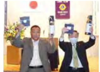
8月の誕生ライオン