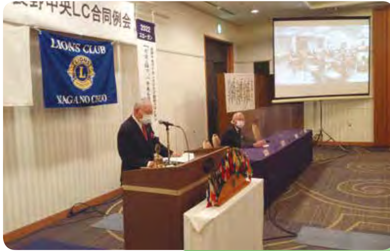
11/24 長野篠ノ井LCとの合同例会