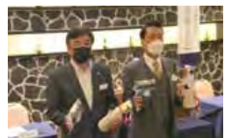
LCIFキャンペーン 100アワードピンの授与