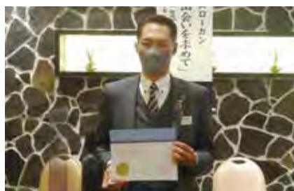
ピンの授与 新入会員スポンサーアワード