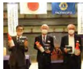
11月の誕生ライオン