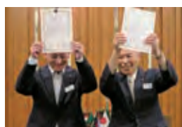
会員増強 個人表彰