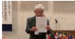
会員増強 メンバーズキー賞受賞