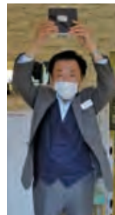
5月の誕生ライオン