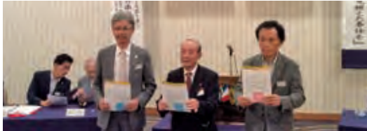
2022年～2023年度 マイルストーン・シェブロン・アワード(長期在籍)受賞