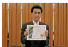
国際会長感謝状受賞