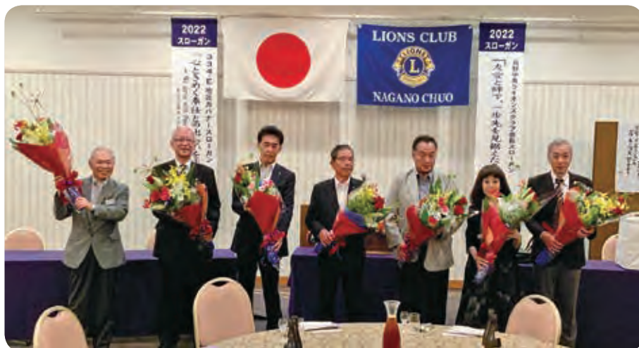
6/15 新旧役員歓送迎例会