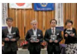
6月の誕生ライオン