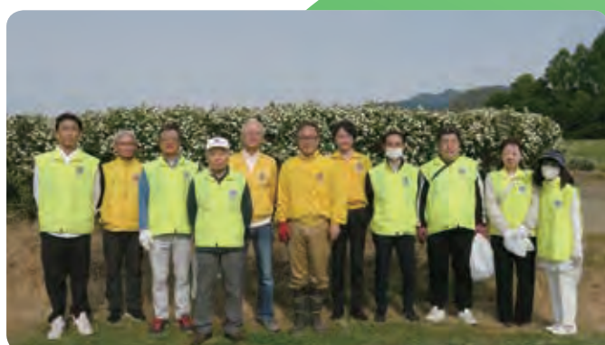
5/13 2R環境保全活動（河川清掃）