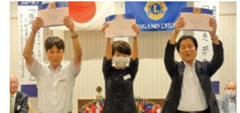
公認ガイディングライオン認定証

第59期各委員会の年間活動報告を行いました。 今期は久しぶりにすべての活動が再開されました。以前の活動を知らない会員もいる状況のなかにあっても、我が長野中央ライオンズクラブは強固な結束と連帯を保ち、これまで以上の活動成果を上げることができたと思っています。 来期は60周年を迎えます。準備もすでに始まっております。会長スローガンである「新たな未来にWe serve」のもと、来期に向けて心強いバトンを渡せたものと確信しております。 今期一年間、ライオンのお誕生日を祝うイベントにおいては、新たな試みとして生まれた日の曜日と気温をお知らせしました。