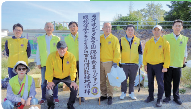
5/14 2R合同環境保全活動