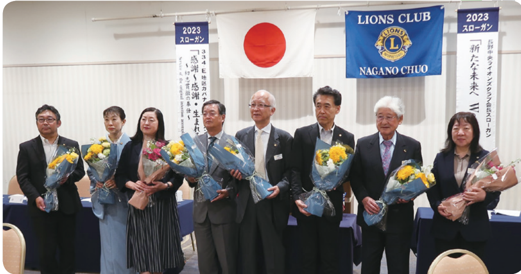
6/20 新旧役員歓送迎例会