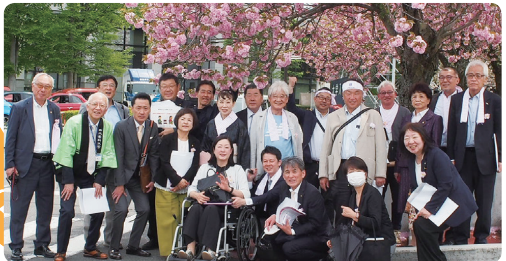
4/29 お花見例会 (松本歯科大学にて)

☆334-E地区 地区ガバナーズスローガン 「感謝～感謝・生まれる絆」 ～初志貫徹の奉仕～ Service of the original intention accomplishment