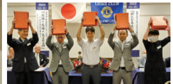
6月の誕生ライオン