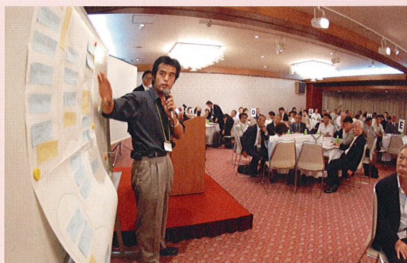
指導力を育成するセミナー

リーダーシップを磨くトレーニングへの参加や、大勢を前にしたスピーチ実践などを通じて、ビジネスの現場でも役立つスキルが身に付きます。