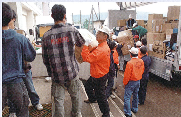
新潟県中越地震における物資救援活動

青少年の育成や、高齢者・障害者への支援活動、植樹など環境保護活動……。あなたの時間と能力を奉仕活動に生かすことができます。