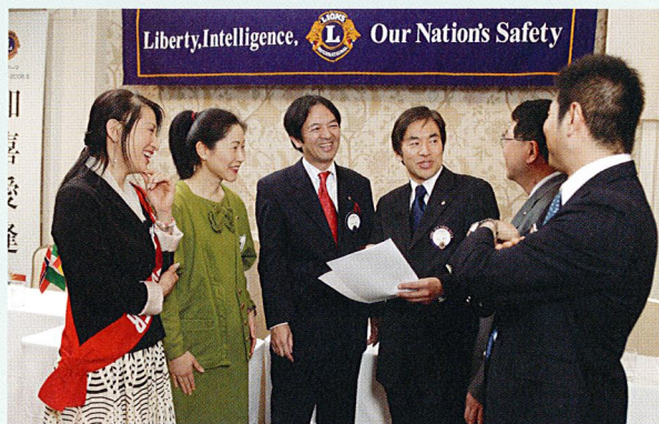
職種や年齢を超えた友情で結ばれた会員たち

さまざまな奉仕活動やクラブ行事を通じて、職業や年齢の違いを超えた多くの仲間と、厚い友情を育むことができます。