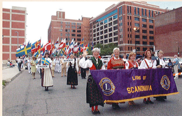
年に一度、世界各国の会員が集う国際大会

ライオンズクラブは国際的なネットワークです。国境を越えた奉仕活動や、会員同士の交流を経験することができます。